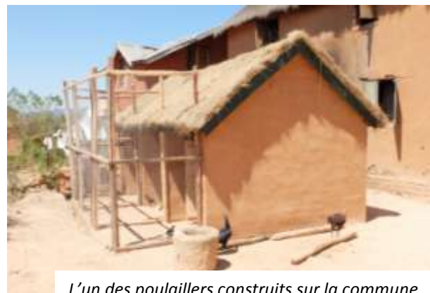
L'un des poulaillers construits sur la commune

Ainsi nous avons entamé en juillet 2015 un nouveau projet pour 30 des bénéficiaires de ce projet avec le financement de poulaillers traditionnels améliorés. L'objectif est de permettre aux éleveurs encore fragiles de pérenniser et stabiliser leur élevage grâce à des poulaillers permettant une meilleure maîtrise des activités et une sécurisation des animaux. Les constructions se sont terminées en octobre 2015, et le résultat est très encourageant. Si, au terme d'une première année de ce projet, d'autres éleveurs souhaitent bénéficier d'un poulailler, nous pourrions reproduire cette action à plus grande échelle.